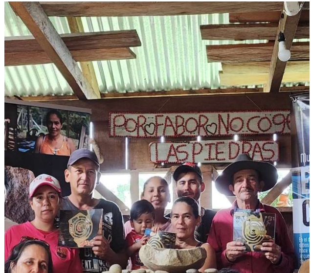
Fotografías de las libretas