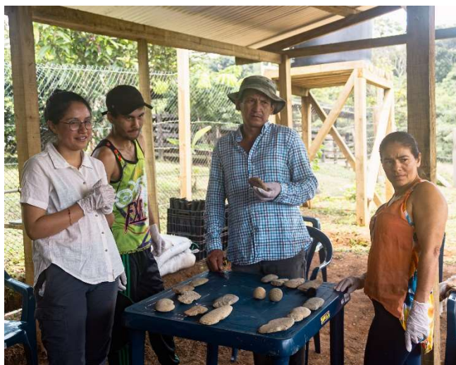
Fotografías de las sesiones del laboratorio de interpretación