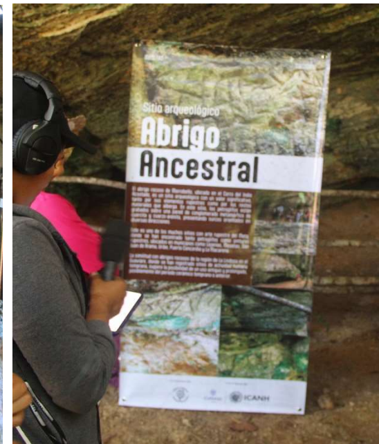
Fotografías de algunos materiales de apoyo a la divulgación en espacio de museos comunitarios