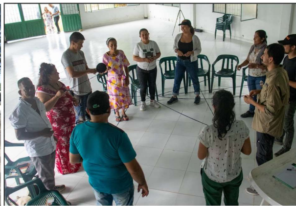
Fotografías de las sesiones de diálogos comunitarios