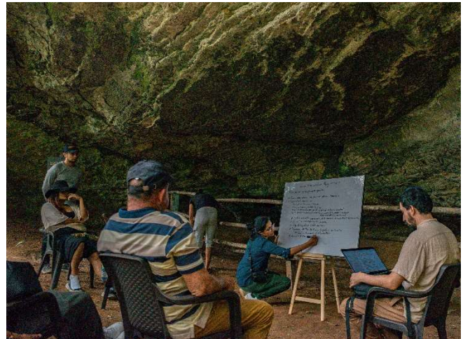
Fotografías de las sesiones del laboratorio de interpretación