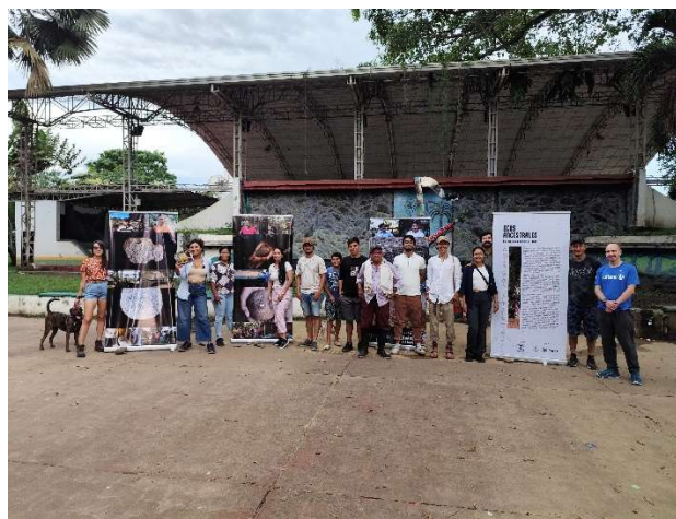
Fotografías de la exposición Itinerante en la vereda de Morrobello y el parque Central de Mesetas